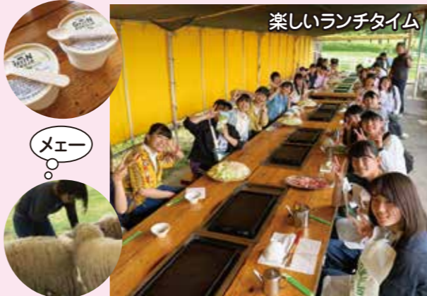
楽しいランチタイム