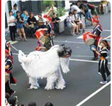
教員有志による沖縄芸能