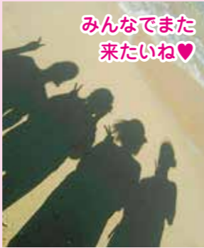
みんなでまた来たいね♡