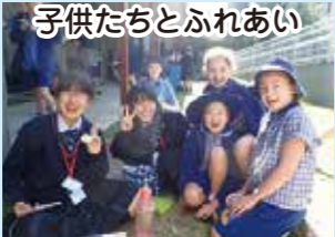
子供たちとふれあい