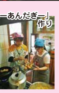
民泊先で「ぎーたーあんだぎー」作り