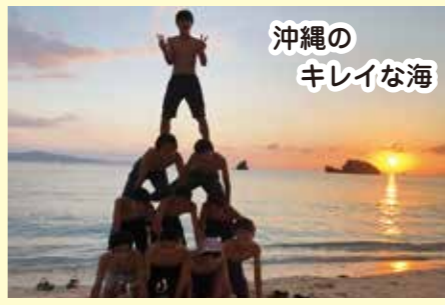
沖縄のキレイな海