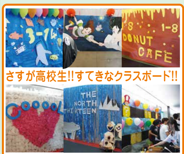
さすが高校生!! 素敵なクラスボード!!