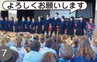
よろしくお願いします