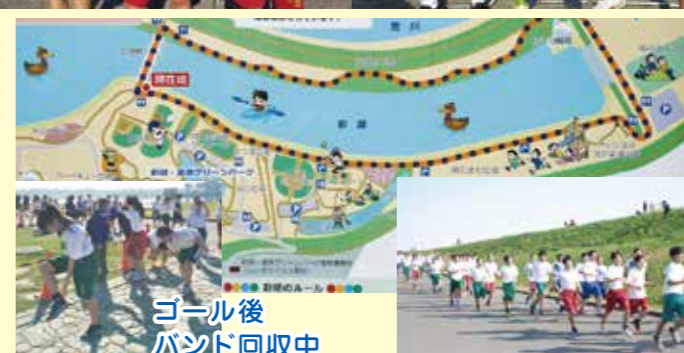
ゴール後 バンド回収中