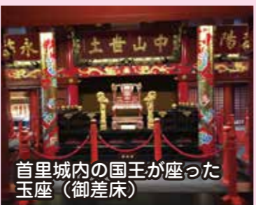
首里城内の国王が座った玉座 (御差床)

「民泊楽しい」「民泊で良かった」そんな生徒の声が印象に残る修学旅行でした。天候にも恵まれ、入寮体験などの平和学習や人の温かさを感じることのできた民泊体験、沖縄の自然や文化に触れることのできたマリオン・文化体験など、様々なことを学ぶことができました。今後の学校生活で成長した生徒の姿を見ることが楽しみです。 江畑 友規先生