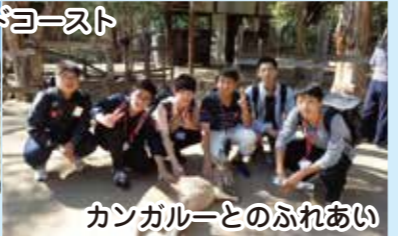
カンガルーとのふれあい