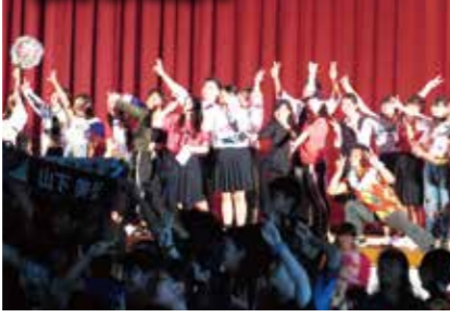
有志が盛り上げました